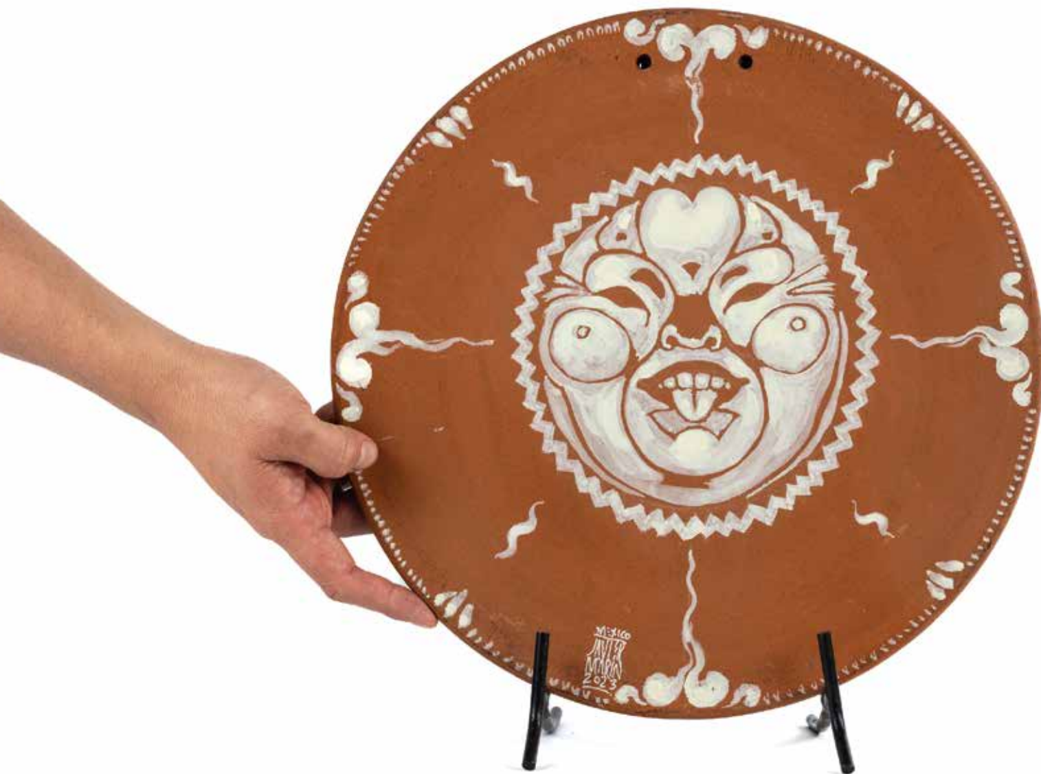
Javier Marín Comal Soles 19, 2023

Acrílico sobre barro 34 x 34 x 2 cm 1.8 Kg PU, Precio: $40,000 pesos