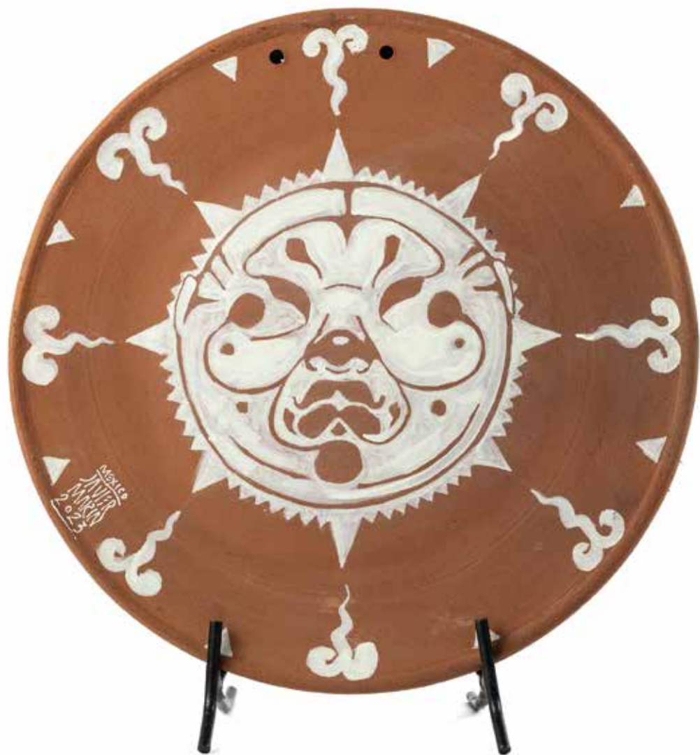
Javier Marín Comal Soles 11, 2023

Acrílico sobre barro 34.5 x 34.5 x 2.5 cm 2 Kg PU, Precio: $40,000 pesos