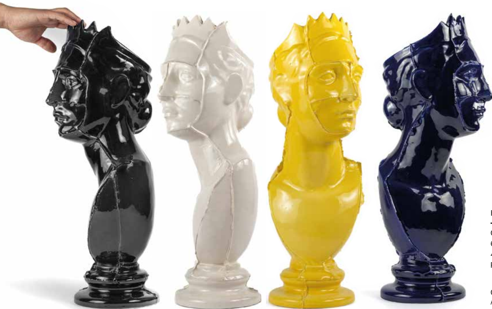
Florero Reina, 2024