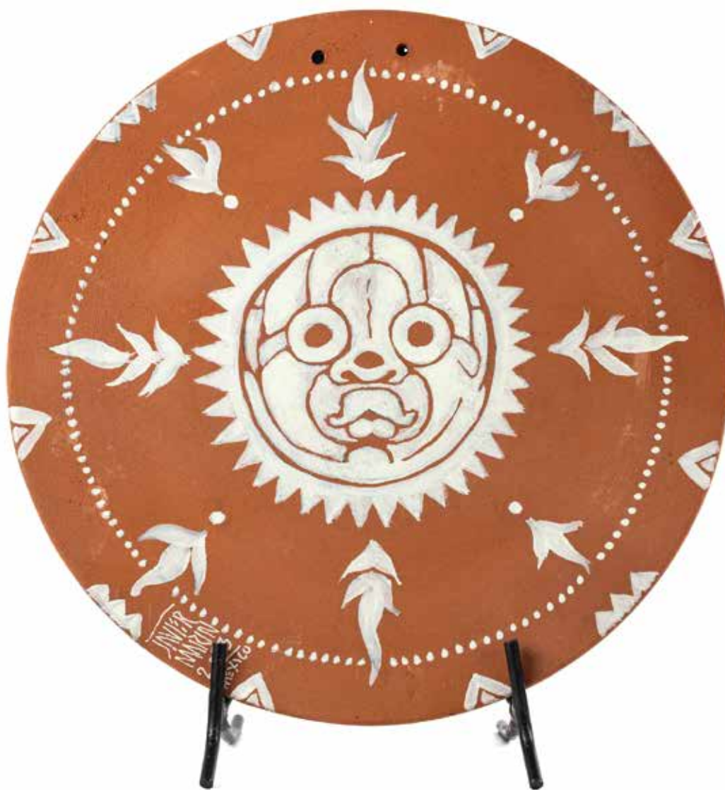
Javier Marín Comal Soles 12, 2023

Acrílico sobre barro 33 x 33 x 2 cm 1.5 Kg PU, Precio: $40,000 pesos