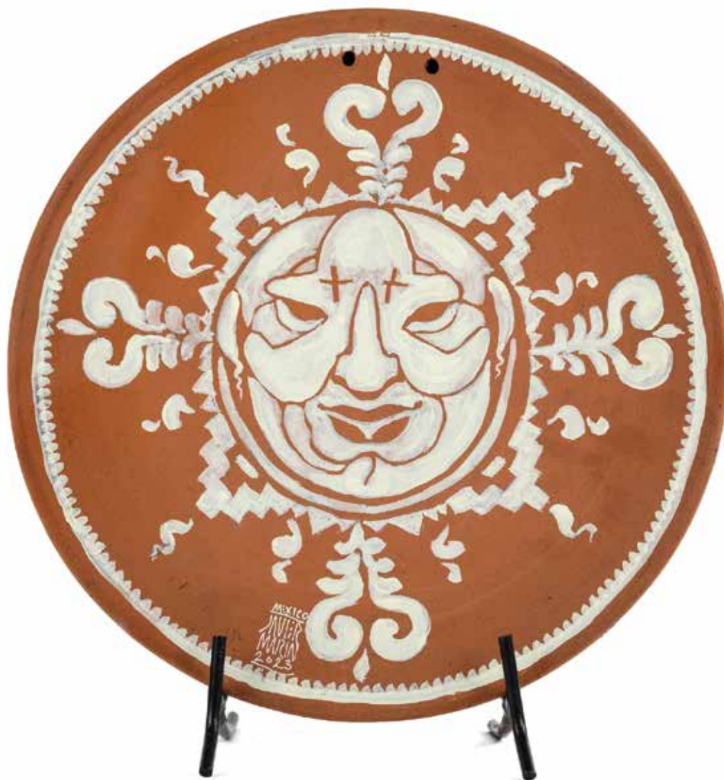
Javier Marín Comal Soles 13, 2023

Acrílico sobre barro 33.5 x 33.5 x 2 cm 1.7 Kg PU, Precio: $40,000 pesos