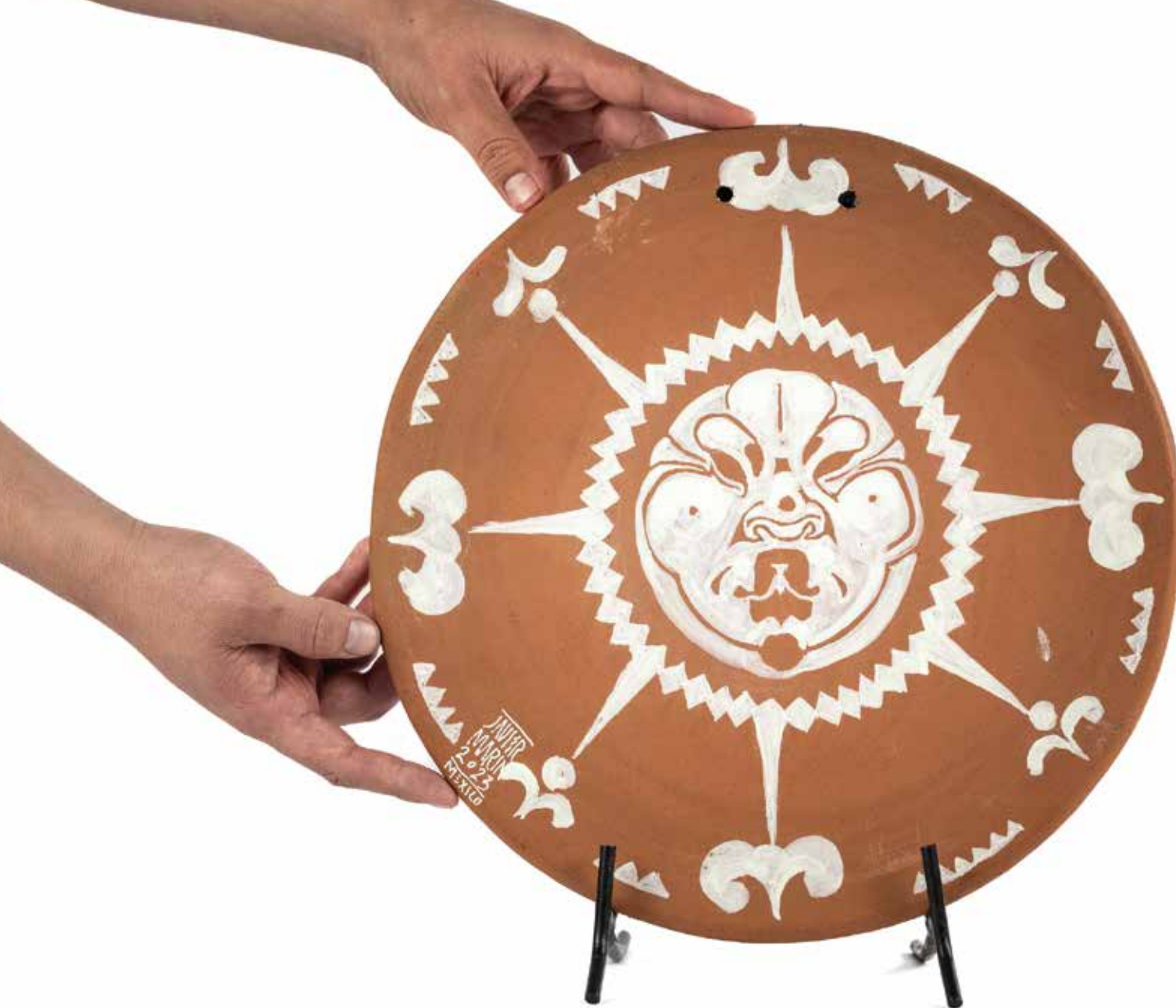
Javier Marín Comal Soles 18, 2023

Acrílico sobre barro 34 x 34 x 2 cm 2 Kg PU, Precio: $40,000 pesos