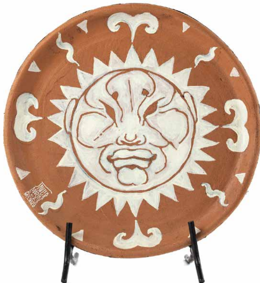
Javier Marín Comal Soles 14, 2023

Acrílico sobre barro 28 x 28 x 3 cm 1.3 Kg PU, Precio: $40,000 pesos