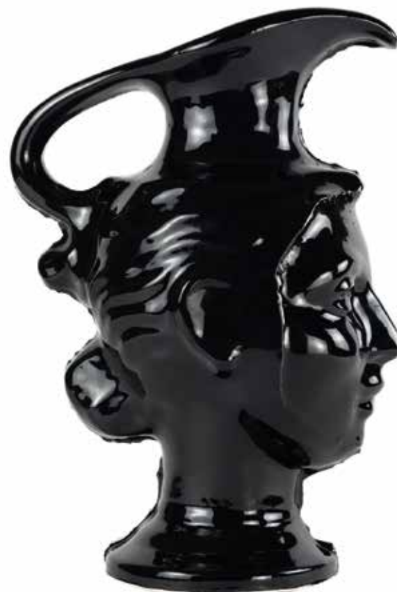
Jarra Sac Chich, 2024